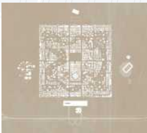
Vlevo masterplan Foster & Partners, vpravo OMA.

V týdnu, kdy Foster & Partners oznámili prodej podílu ve firmě společnosti 3i, byla kancelář nucena obhajovat svůj právě zveřejněný projekt “zero-carbon, zero-waste” města v Abu Dhabi, kvůli jeho podobnosti se sousedním developmentem Rak Gateway podle návrhu Koolhaasova studia OMA.